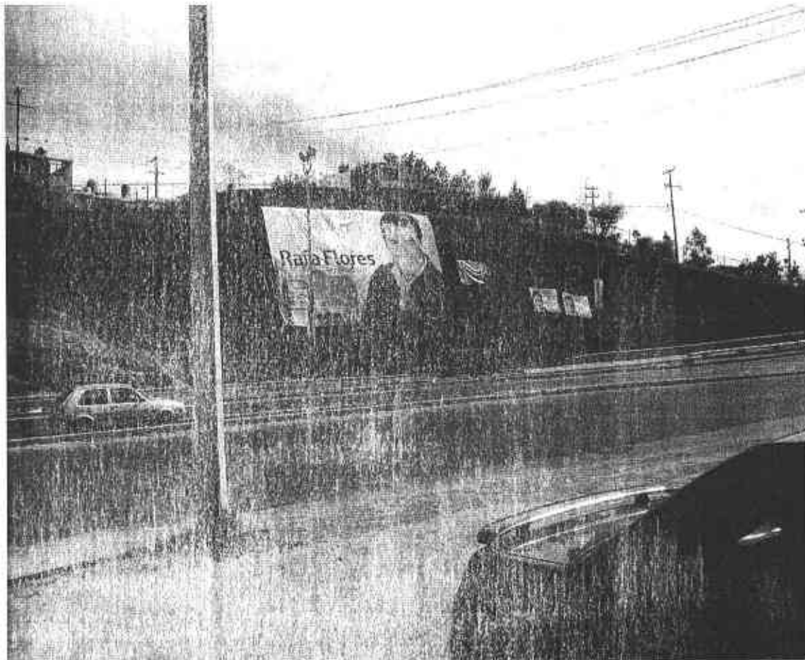
Fotografía # 8

Se observa una lona publicitaria fijada en los límites de una vialidad, con una imagen que por su contenido se presume pertenece al C. Rafael Flores Mendoza, con los textos siguientes: de la parte superior izquierdo "VAMOS JUNTOS POR GUADALUPE" en la parte central se lee "Rafael Flores NUESTRO PRESIDENTE", en la parte inferior izquierda el logotipo de la coalición "Zacatecas nos Une" y la dirección electrónica www.rafaelflores .