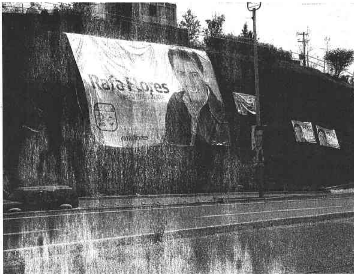
Fotografía # 6

Se observa una lona publicitaria fijada en los límites de una vialidad, con una imagen que por su contenido se presume pertenece al C. Rafael Flores Mendoza, con los textos siguientes: del lado superior izquierdo "VAMOS JUNTOS POR GUADALUPE" en la parte central izquierda "Rafa Flores NUESTRO PRESIDENTE", en la parte inferior izquierda el logotipo de la coalición "Zacatecas nos Une" y la dirección electrónica www.rafaflores .