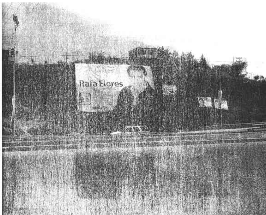
Fotografía # 2

Se observa al fondo una lona publicitaria colocada en los límites de una vialidad, en la cual se observa una imagen que por su contenido se presume pertenece al C. Rafael Flores Mendoza, con los textos siguientes: del lado superior izquierdo "VAMOS JUNTOS POR GUADALUPE" en la parte central izquierda "Rafa Flores NUESTRO PRESIDENTE", en la parte inferior izquierda el logotipo de la coalición "Zacatecas nos Une" y la dirección electrónica www.rafaflores .