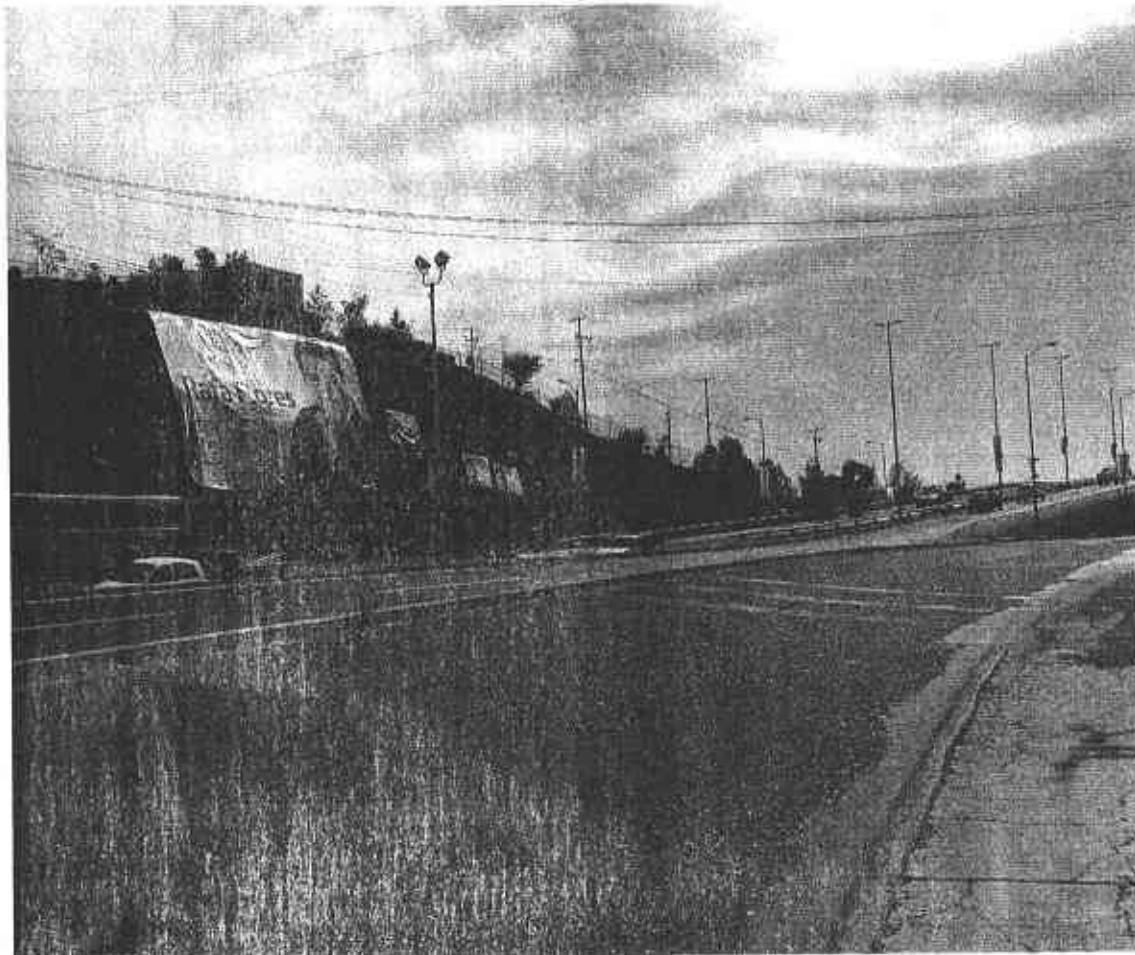
Fotografía # 4

Se observa una lona publicitaria fijada en los límites de una vialidad, con la imagen que por su contenido se presume pertenece al C. Rafael Flores Mendoza, asimismo en dicha lona se tienen los textos siguientes: del lado superior izquierdo "VAMOS JUNTOS POR GUADALUPE" en la parte central izquierda "Rafa Flores NUESTRO PRESIDENTE", en la parte inferior izquierda el logotipo de la coalición "Zacatecas nos Une" y la dirección electrónica www.rafaflores .