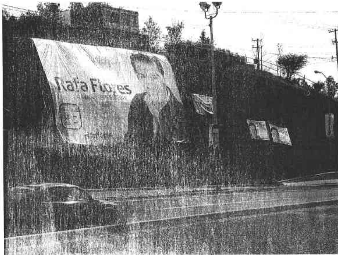
Fotografía # 5

Se observa una lona publicitaria fijada en los límites de una vialidad, que por su contenido se presume pertenece al C. Rafael Flores Mendoza, con los textos siguientes: del lado superior izquierdo "VAMOS JUNTOS POR GUADALUPE" en la parte central izquierda "Rafa Flores nuestro presidente", en la parte inferior izquierda el logotipo de la coalición "Zacatecas nos Une" y la dirección electrónica www.rafaflores.com .