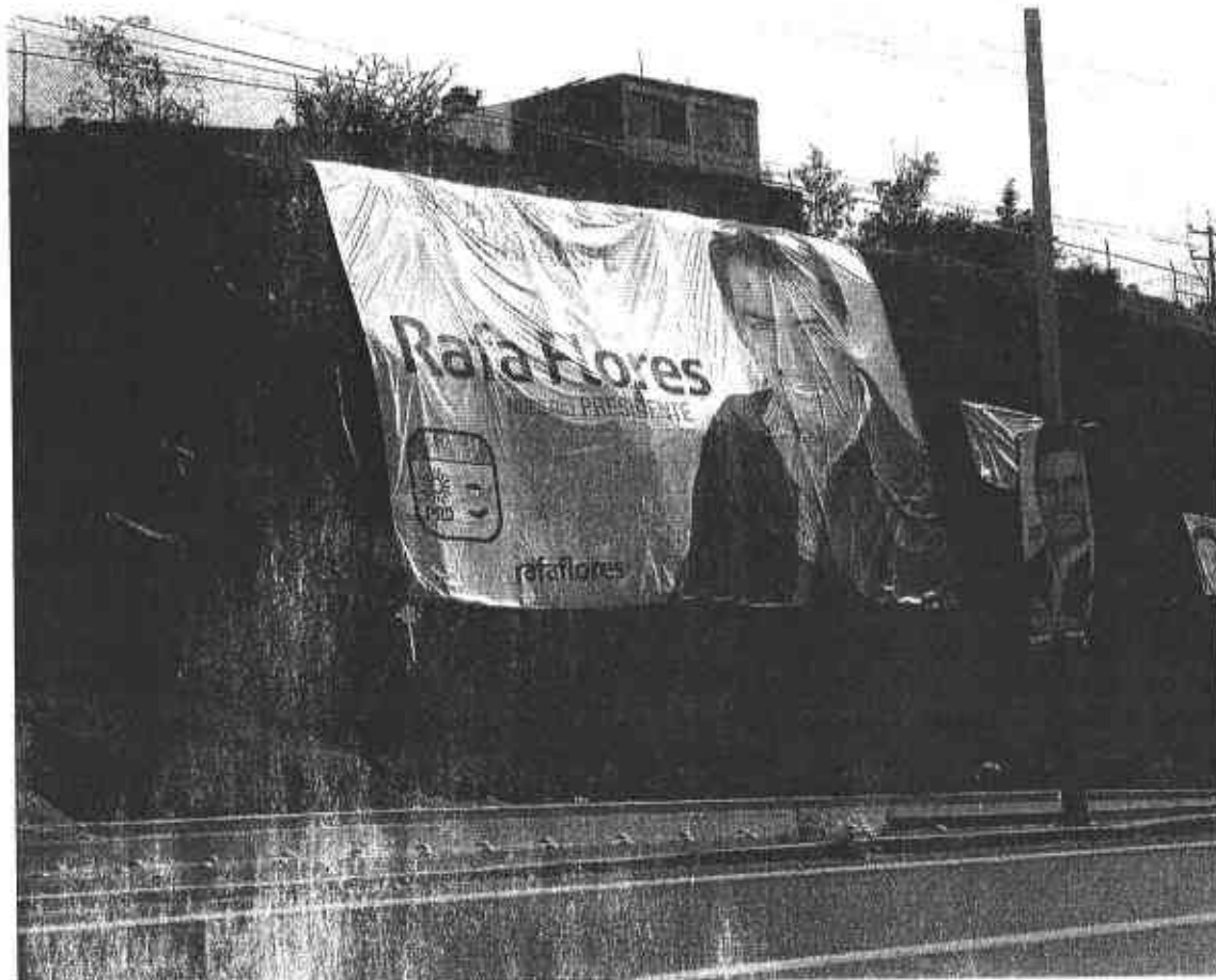
Fotografía # 3

Se observa una lona publicitaria fijada sobre los límites de una vialidad, con una imagen que por su contenido se presume pertenece al C. Rafael Flores Mendoza, asimismo, dicha lona contiene los textos siguientes: del lado superior izquierdo "VAMOS JUNTOS POR GUADALUPE" en la parte central izquierda "Rafa Flores NUESTRO PRESIDENTE", en la parte inferior izquierda el logotipo de la coalición "Zacatecas nos Une" y la dirección electrónica www.rafaflores.com .