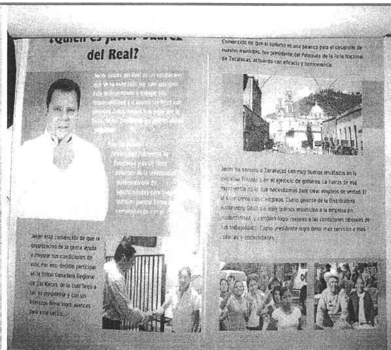
Díptico # 1

Ofrecido como prueba, en la queja presentada en fecha 22 de junio de 2007